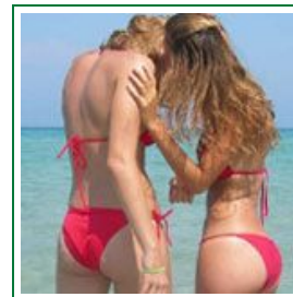
Turismo gay a Gallipoli, meta preferita nel Salento